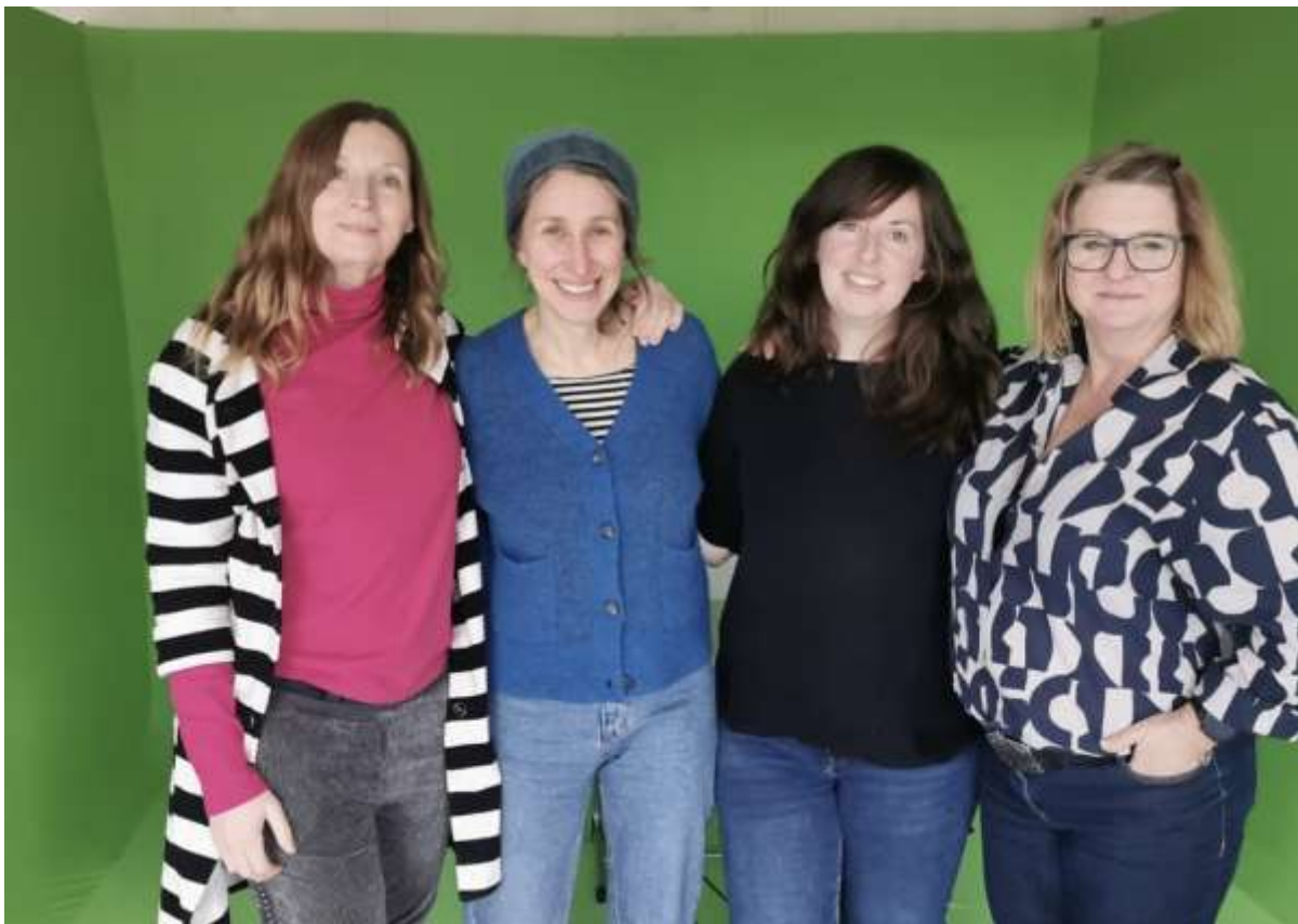
2.v.r. an der Ernst-Haeckel-Schule.

Niedrigschwellige Einführung in die Neothek: Durch gezielte Führungen und praxisnahe Beispiele wurden sowohl Schüler*innen als auch Fachkolleg*innen neugierig gemacht und zur aktiven Nutzung angeregt – eine Basis für breitere Teilhabe im neuen Jahr.