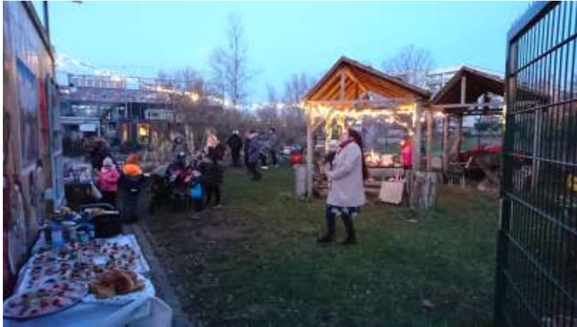
Foto links: Mit der mittlerweile traditionellen Adventsoase im Dezember wurde auch in diesem Jahr die Saison mit einem gemütlichen kleinen Fest mit mehr als 50 Gästen abgeschlossen. Den Ehrenamtlichen wurde in diesem Rahmen für Ihr Engagement und ihr Durchhaltevermögen trotz der erschwerten Bedingungen gedankt. Kinder und

zu einem essbaren Waldgarten bepflanzt werden wird. Auch in diesem Projekt ist es das Ziel, Menschen aus der Nachbarschaft zu aktivieren und zu motivieren, sich beim Gestalten, Pflanzen, Pflegen und Ernten einzubringen, um etwas für die eigene Gesundheit, das Wissen um Umwelt und Klimaschutz und die Vernetzung untereinander zu tun.